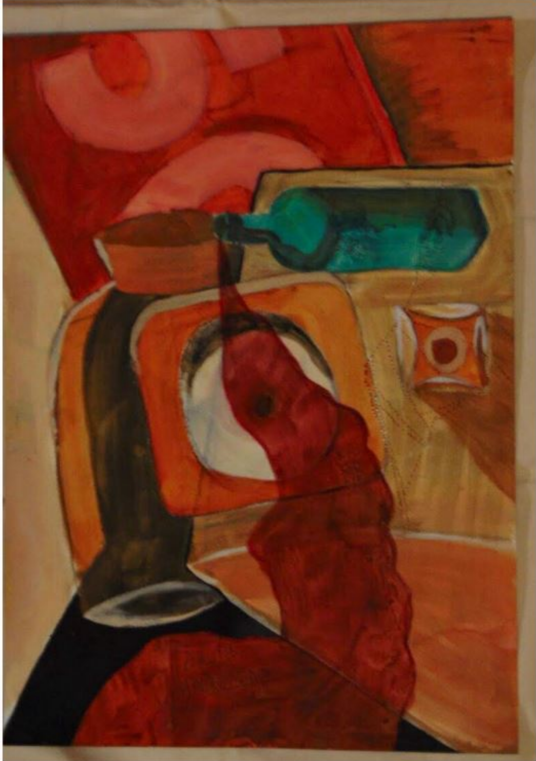
'Barrica' representa dilemas comunes recurrentes reflexionados con whisky, según el autor.