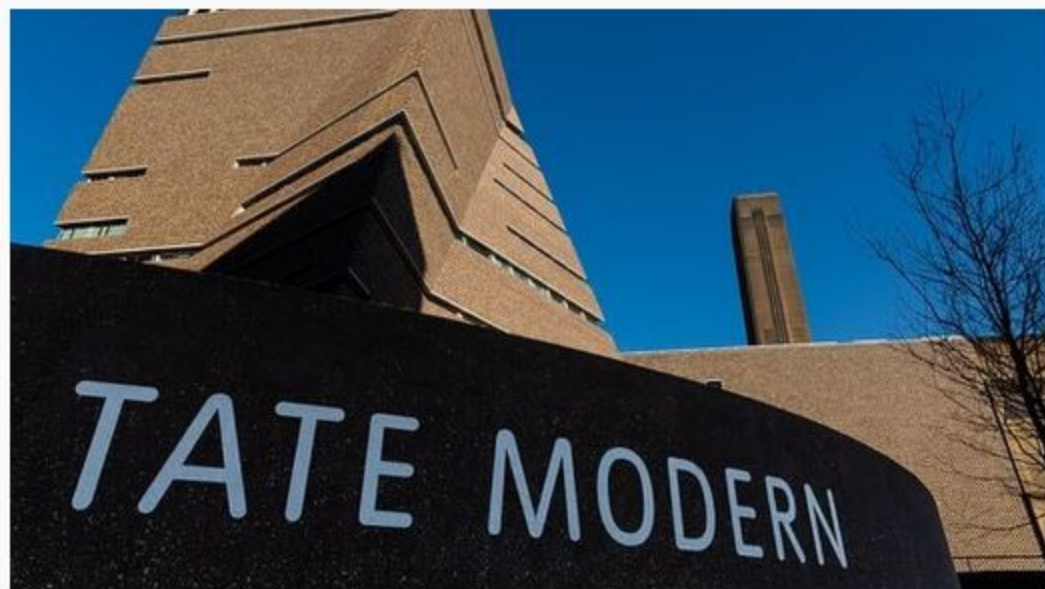
Fachada de la Tate Modern Gallery de Londres (Museo Nacional Británico de Arte Moderno).