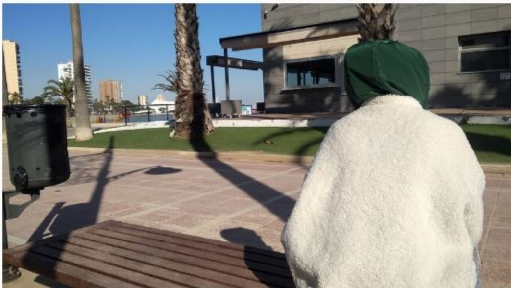
La hermana de Shakeel, sentada en el paseo marítimo, prefiere preservar su anonimato. Badía